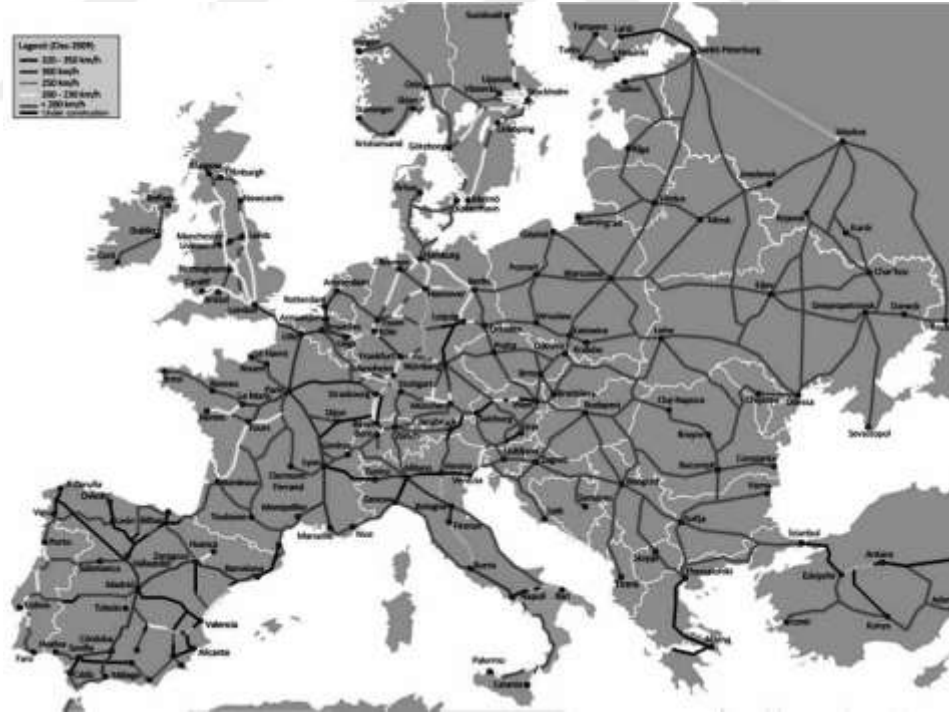
Şekil 3.1. Avrupa’nın Demiryolları Haritası.

Avrupa 65.000 km otoyolu ve büyük havaalanlarıyla ciddi bir ulaşım altyapısına sahiptir. Avrupa’nın belli başlı 30 havalimanından yıllık 10 milyondan fazla yolcunun transferi gerçekleştirilmektedir. Bunun yanısıra Avrupa’da en güzel ulaşım araçlarından biri de trenyoludur. Avrupa Birliği ülkelerindeki hızlı tren ağı (6.200 km) dünya üzerinde bu anlamda en geniş ağı oluşturmuştur (Delagation of the European Union to Turkey, 2013).