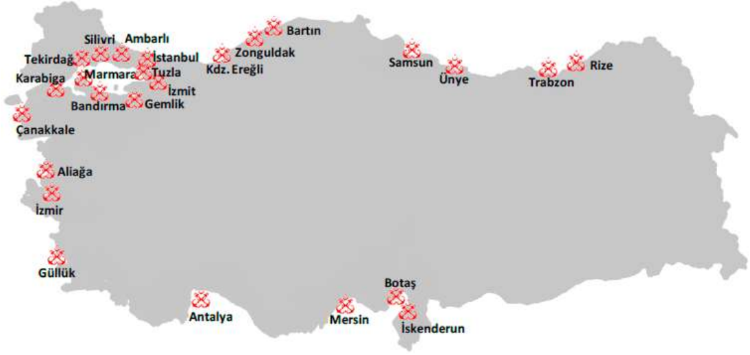
Şekil 3.3: Başlıca Limanlar.

Denizyolunun 7 gün 24 saat yüksek teknoloji ile takibi yapılan, güvenli bir şekilde kullanımı dikkat çekmektedir. Denizyolu çevresinin temiz ve emniyetli olması denizyolu taşımacılığında toplam ticaret hacimlerini etkileyecektir. Türkiye transit geçişler için de uygun bir güzergahta yer almaktadır.