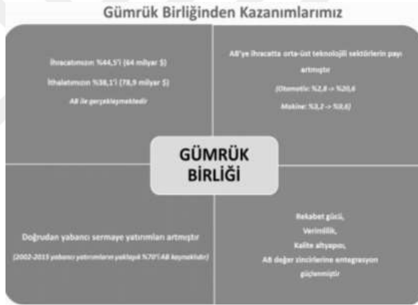
Şekil 3.1: Gümrük Birliği Uygulaması Türkiye Ekonomisine Ne Getirmiştir?

Ekonomik büyüme hızı, birçok ülkeninkinden daha yüksektir. Alım gücü arttıkça tüketim malları talebi, buna bağlı olarak da yeni teknoloji ve yatırım malları talebi artmaktadır. Dolayısıyla yatırım malı üreticisi olan AB ülkeleri için, Türkiye büyük ve canlı bir yatırım malı piyasası durumundadır. Bunda Türkiye'nin diğer uluslararası ilişkilerinin de katkısı vardır (Dura, Atik, & Dumrul, 2015, s. 600).