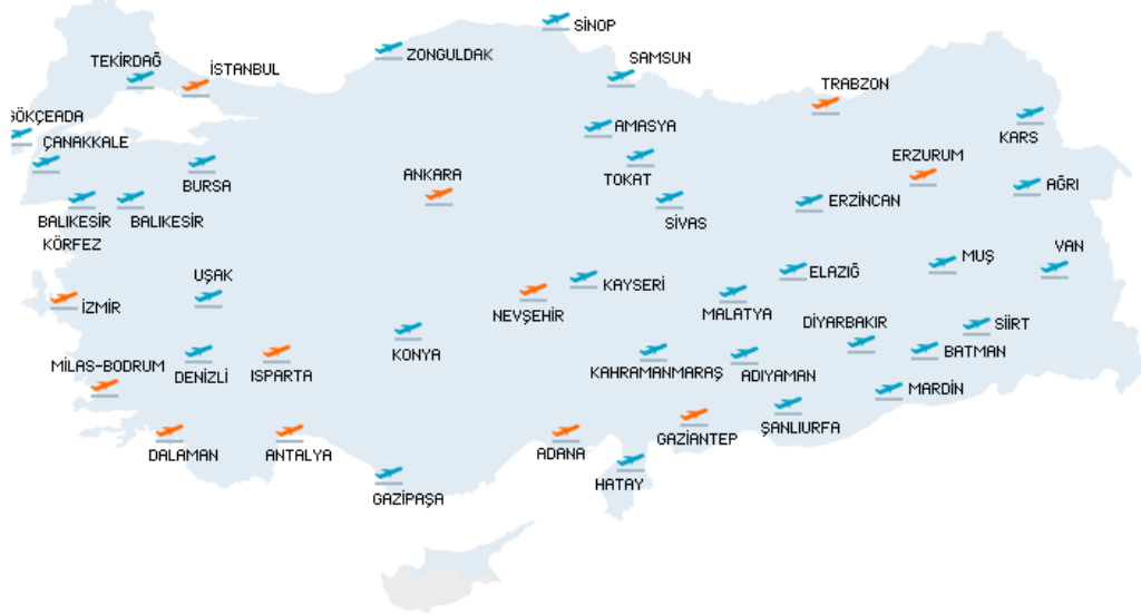
Şekil 3.4: Başlıca Hava Alanları (Kaynak: Havayolu Taşımacılığı Ağı (Deloitte, 2010)).

Türkiye hava ulaştırma alanında anlaşma yaptığı ülkeleri de artırmış ve bugün itibarıyla 169 ülke ile anlaşma yapılmıştır. 2000’li yıllarda bu sayı 880 civarındaydı. Dünya genelinde farklı niteliklerde irili ufaklı havaalanı sayısı 14 binlerdedir. 2012 yılı verilerine göre Türkiye’de bu sayı 67’dir (Doğu Akdeniz Kalkınma Ajansı Sektör Raporu Lojistik, 2014, s. 16).