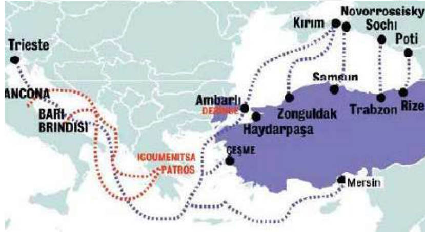
Şekil 3.5: Başlıca Ro-Ro Hatları (Kaynak: Ro-Ro hatları (UTİKAD, 2011)).

2008 yılında karayolu transferlerinin yüzde 18 gibi önemli bir bölümü Ro-Ro aracılığıyla yapılmıştır. Türkiye ticaret hacmi ve ekonomisindeki büyüme ile orantılı şekilde konteyner taşımacılığı için Ro-Ro kullanım kapasitesini artırmaktadır. Bu alanda yapılacak yeni yatırımlar gümrük birliği sonrasında ülke ticaretine ivme kazandırmıştır. Buradaki kapasite artırımını gümrük birliğinin sağlandığı ilk yıllara göre giderek artarken ve bu artışın ticarete yansımaları olmaktadır (Deloitte, 2010).